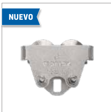
cromox® CARRO PORTA POLEAS CHT , grado 60