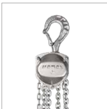
cromox® POLIPASTO DE CADENAS CCH-200 , grado 60