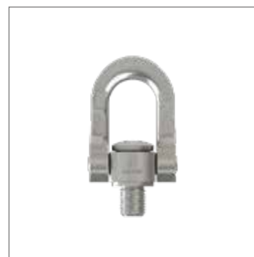
cromox® CÁNCAMOS GIRATORIOS CDAW , grado 60