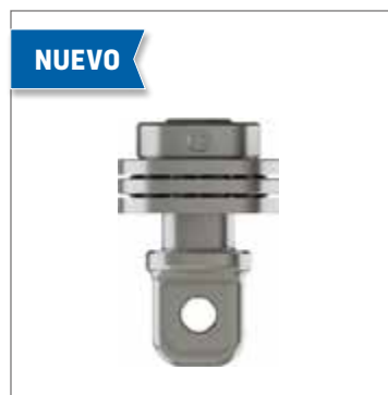
cromox® ELEMENTO DE CONEXIÓN CRC